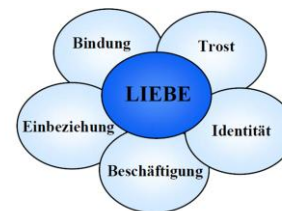
Abb. 11: Die wichtigsten psychischen Bedürfnisse von Menschen mit Demenz (entnommen aus Kitwood, Demenz, 2000, S.122, Abb.6.1)