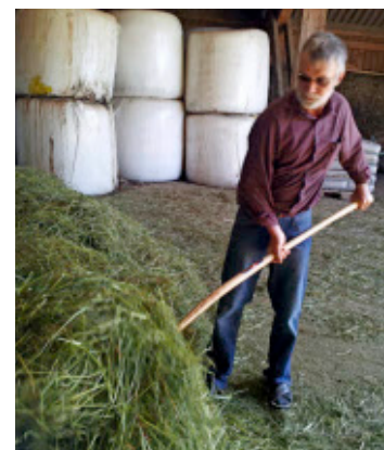
Auch bei landwirtschaftlichen Tätigkeiten können sich die Gäste nützlich machen.

Nähere Informationen zum Thema gibt es per Mail unter hschiller@lksh.de . Interessant ist in diesem Zusammenhang auch die Website www.greencare-oe.at . bos