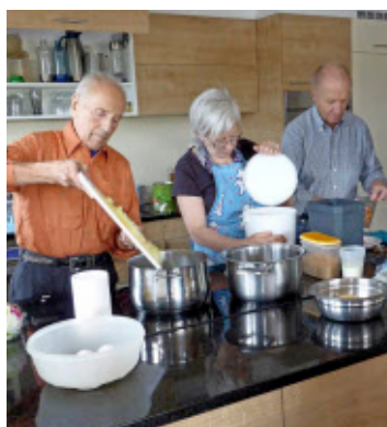
Die Menschen mit Demenz können beim Kochen mithelfen.

Die Nachfrage sei groß, stellt Hafner fest. Nicht zuletzt deshalb hat sie Erweiterungspläne. Aber auch deshalb, weil sie durch eine Erweiterung ihre Einnahmen verbessern könnte. Durch die aufwendige Betreuung und die wenigen Plätze sei die Betreuung kostenintensiv – und deshalb immer noch defizitär und werde durch eine Stiftung unterstützt. Insgesamt arbeiten 21 Betreuungspersonen und neun Freiwillige im Schichtbetrieb. Für einen Tag bekommt sie bei Gästen, die übernachten, im Durchschnitt insgesamt 250 Franken bezahlt. Rund 150 Franken davon müssen die Gäste selbst bezahlen, gut 50 Franken bezahlt die Krankenkasse und weitere knapp 50 Franken die Gemeinde, in der die dementen Menschen ihren Wohnsitz haben. bos www.hof-obergruet.ch